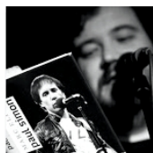
Open Mic uvádí: Sounds of Simon